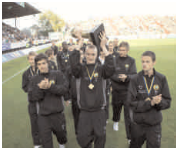
P93 firas på Söderstadion efter segern i Gothia Cup 2008

Utomhussäsongens träningsmatcher började i mars och vi genomförde sju träningsmatcher under våren. Under påsklovet åkte laget på träningsläger i fem dagar till Sidei Turkiet. Under detta träningsläger spelades även två träningsmatcher. I maj spelade laget Nørhøne Cup i Danmark (P16) och laget åkte hem som segrare efter vinst mot Aalborg i